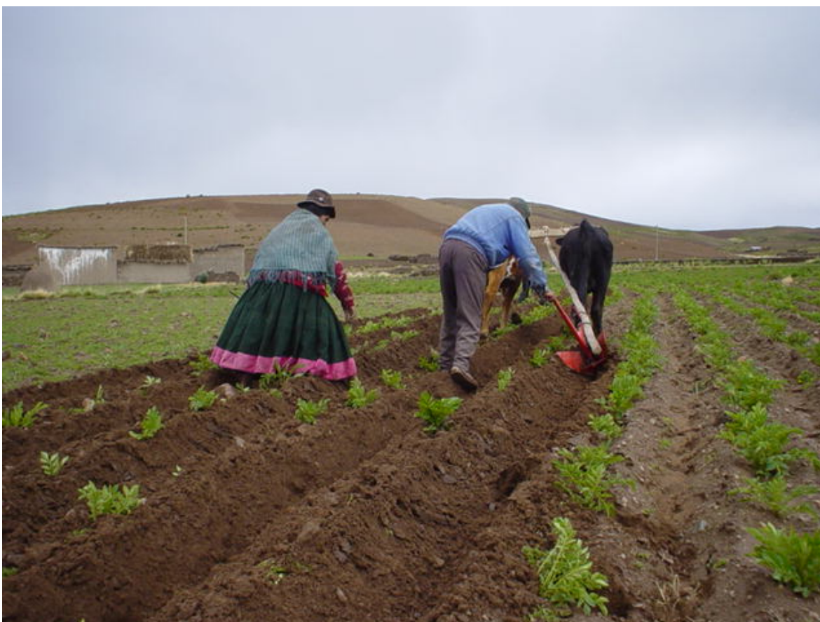
Agricultores de Kellhuiri, Umala, La Paz, prueban el arado múltiple mejorado