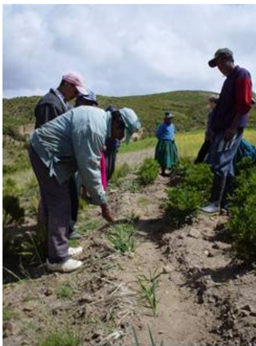
Arriba. Agricultores de Pomposillo, Umala, La Paz evalúan el Falaris como barrera viva.

1996-99. El Proyecto Laderas (PROLADE) prueba falaris como barreras vivas para la conservación de suelo en los valles de Cochabamba y Santa Cruz. El pasto prospera y los agricultores y ONGs empiezan a aceptarlo en Cochabamba y otras zonas.