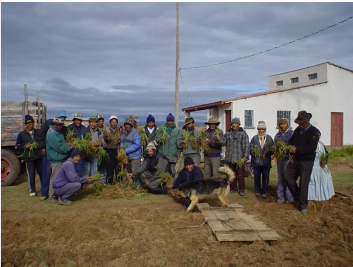
Arriba. Agricultores de Iñacamaya, Umala, La Paz compran plantas de falaris para multiplicarlas en sus parcelas.

En las evaluaciones participativas en los GETs, la gente dice que falaris se queda verde después de las heladas. Es fácil su transplante, controla la erosión, rebrota bien, y es barato establecerlo.